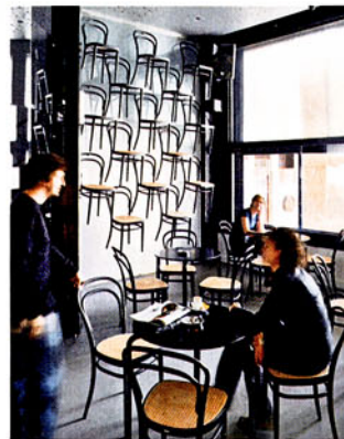
Gesucht: die schönsten Fotos des Kaffeehausstuhls »No. 14« von Thonet